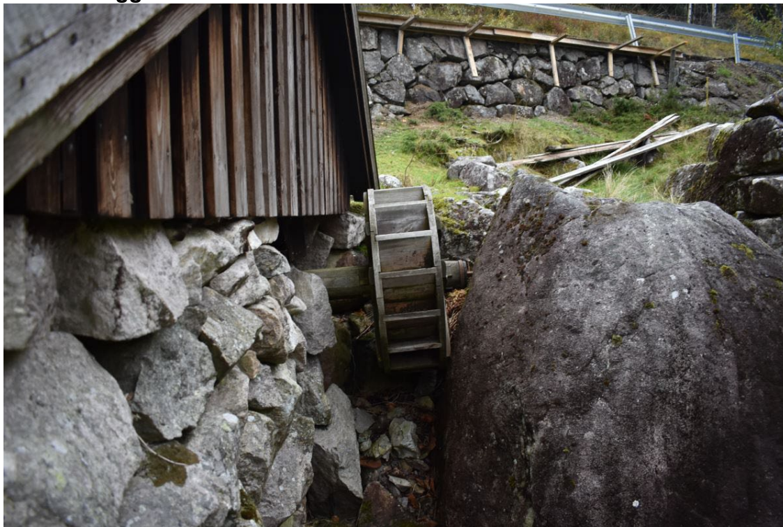
Vannhjulet på tørkehuset. Rogaland fylkeskommune, 08.10.2024