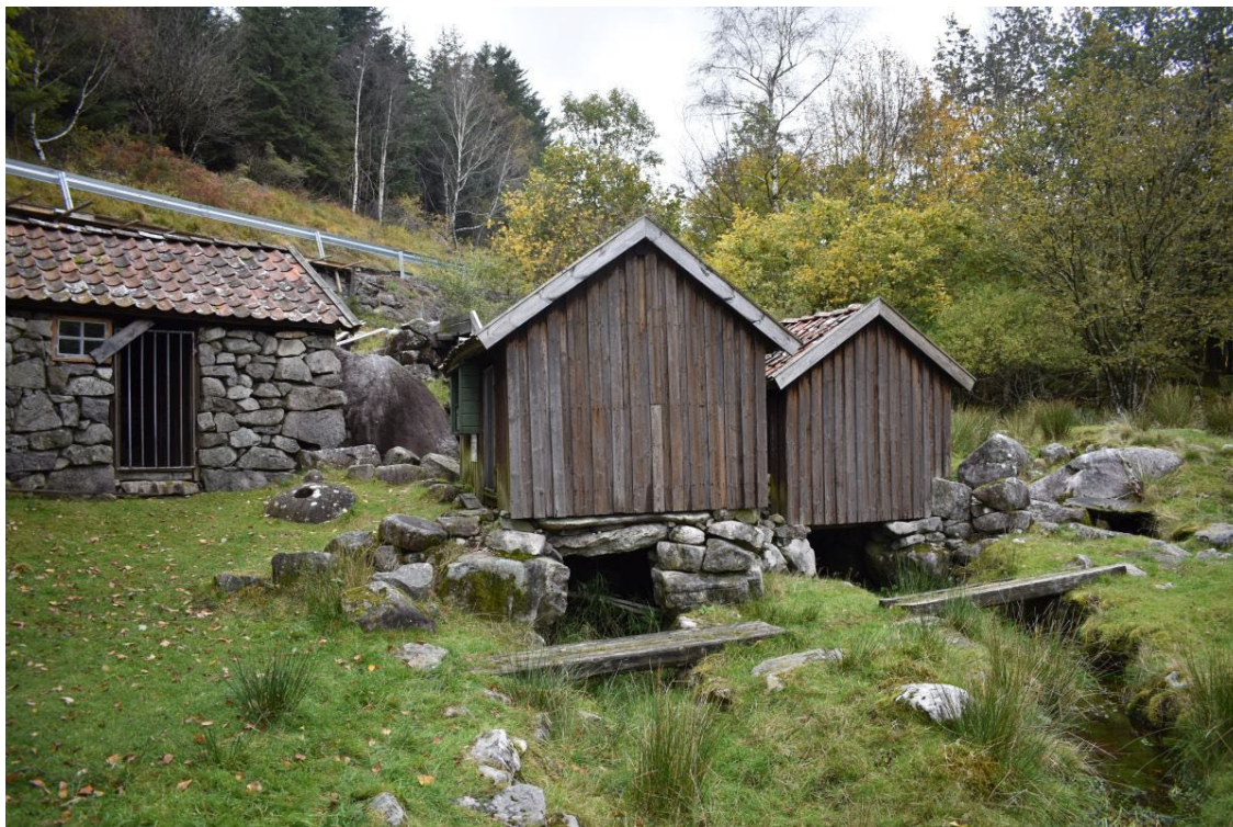
To Kvernhus og korn tørke til høyre. Rogaland fylkeskommune, 08.10.2024 15:33