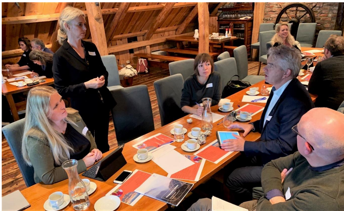
Fra medvirkningsmøte i Feylingsbua i Egersund i oktober 2019.

I tidlig fase ble det også sendt ut en spørreundersøkelse til kommunene, for å kartlegge planer om kommunal planstrategi og hvilke temaer som ville bli vektlagt. Da færre enn halvparten av kommunene svarte, blir ikke resultatene gjengitt her. Svarene ga likevel en tidlig indikasjon på temaer som kommunene var opptatt av, og var med på å forme videre medvirkning.