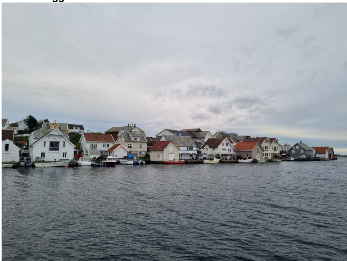
Nordre del av Leiasundet.