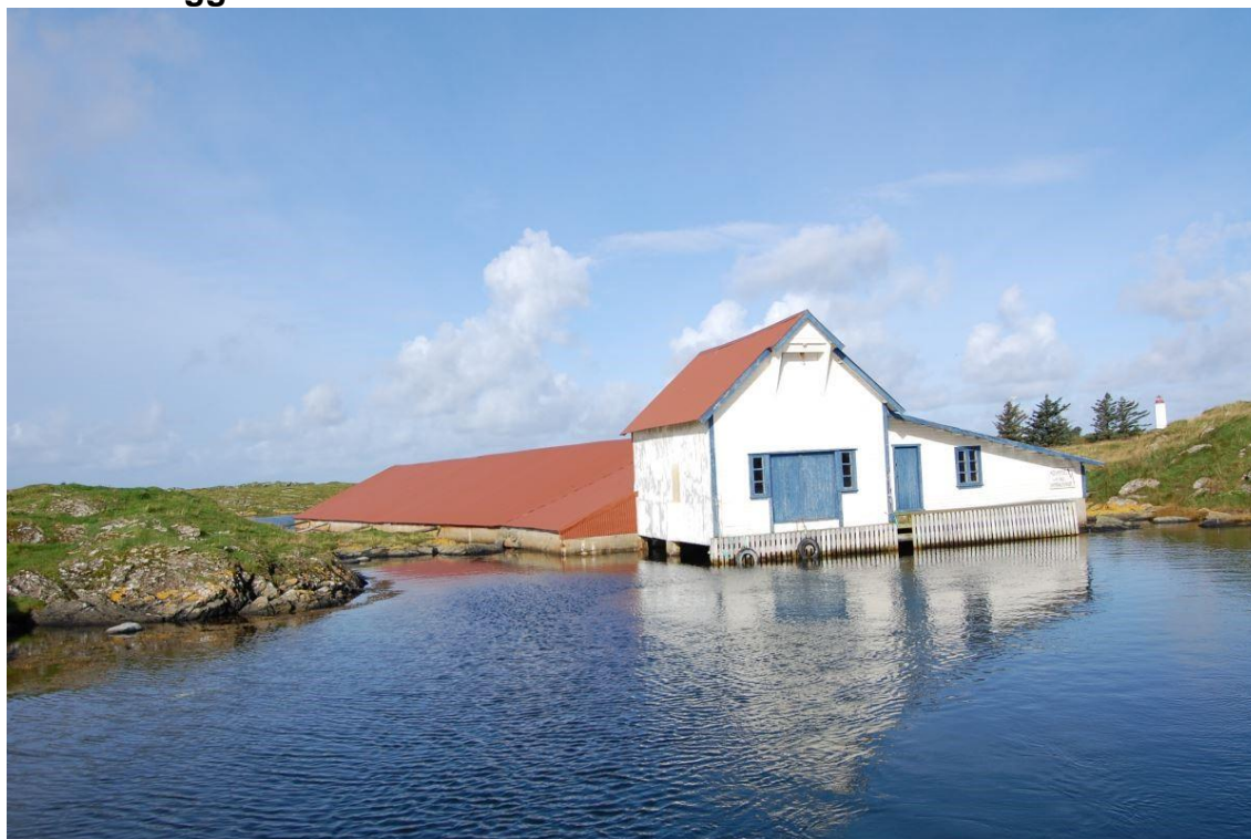
Hummerpark på Kvitsøy.