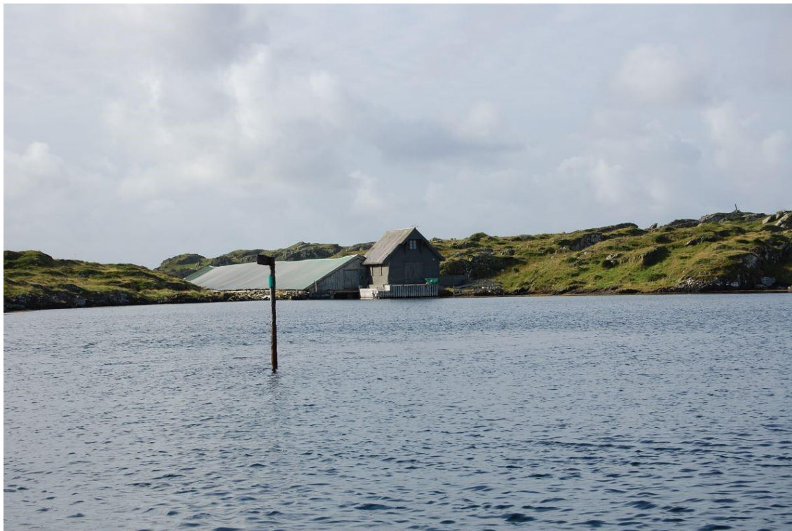
Hummerpark på Kvitsøy