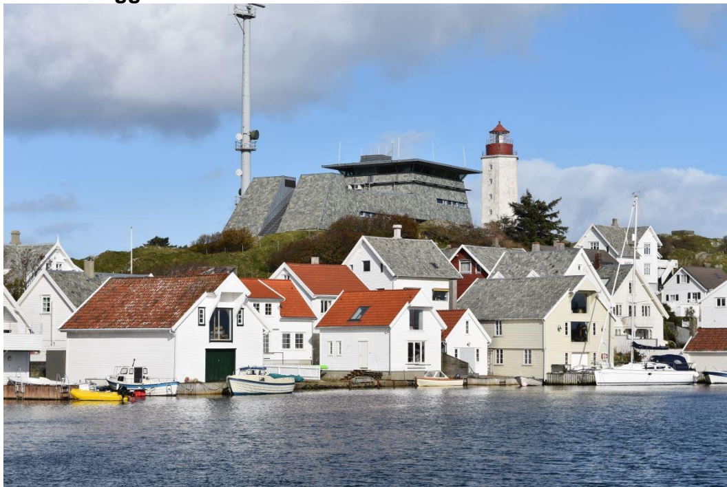
Utsikt fra Grøningen til Trafikksentral og Kvitsøy fyr.