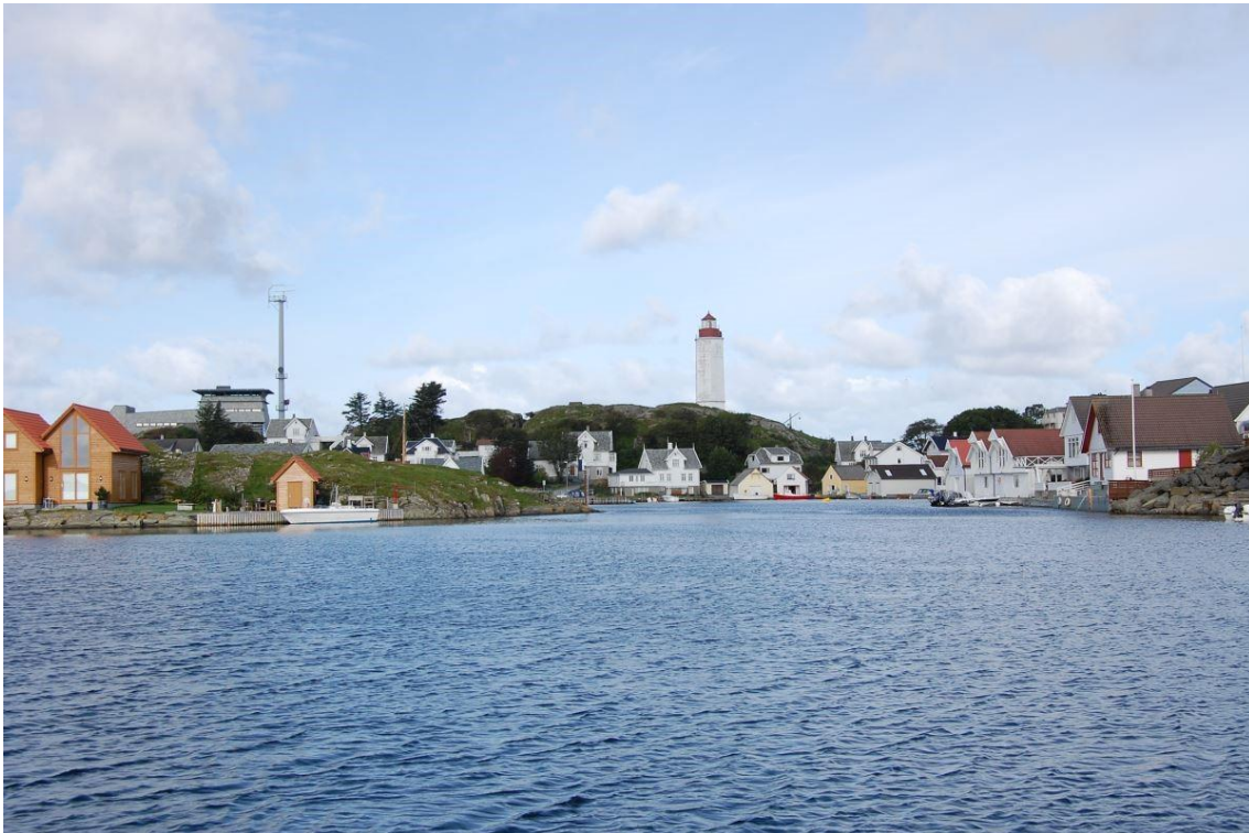
Kvitsøy fyr troner over bebyggelsen i Ydstebøhavn