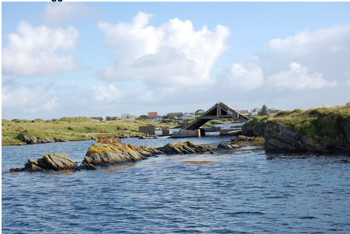
Hummerpark på Kvitsoy.