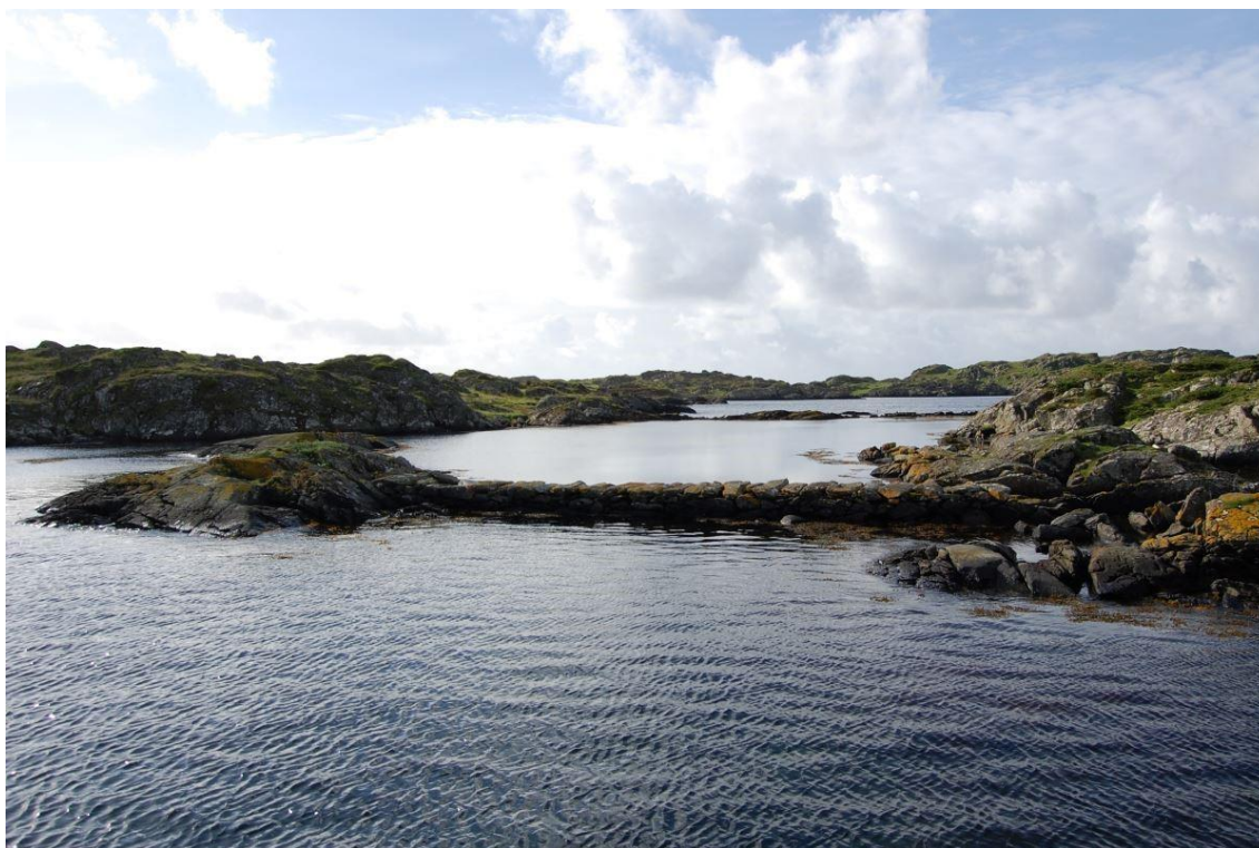
Hummerpark på Kvitsøy