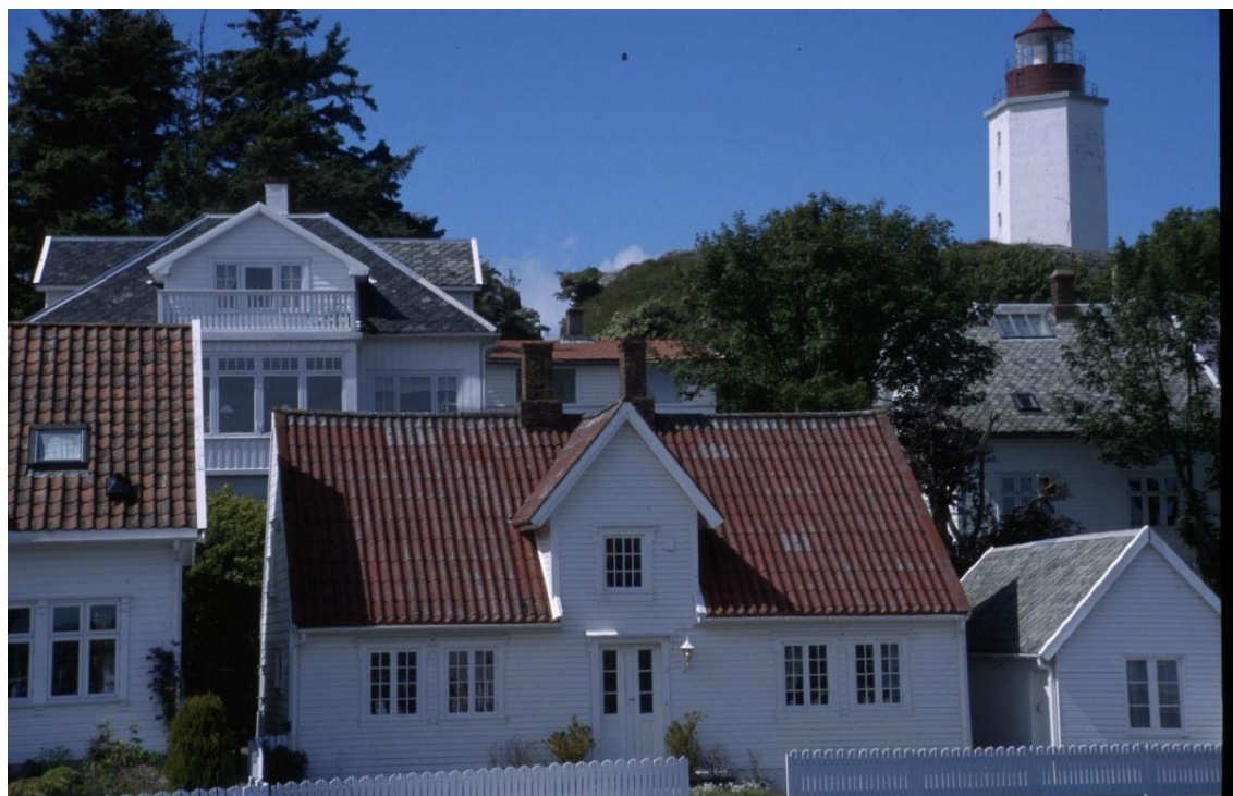
Eldre boligbebyggelse i Ydstebøhamn