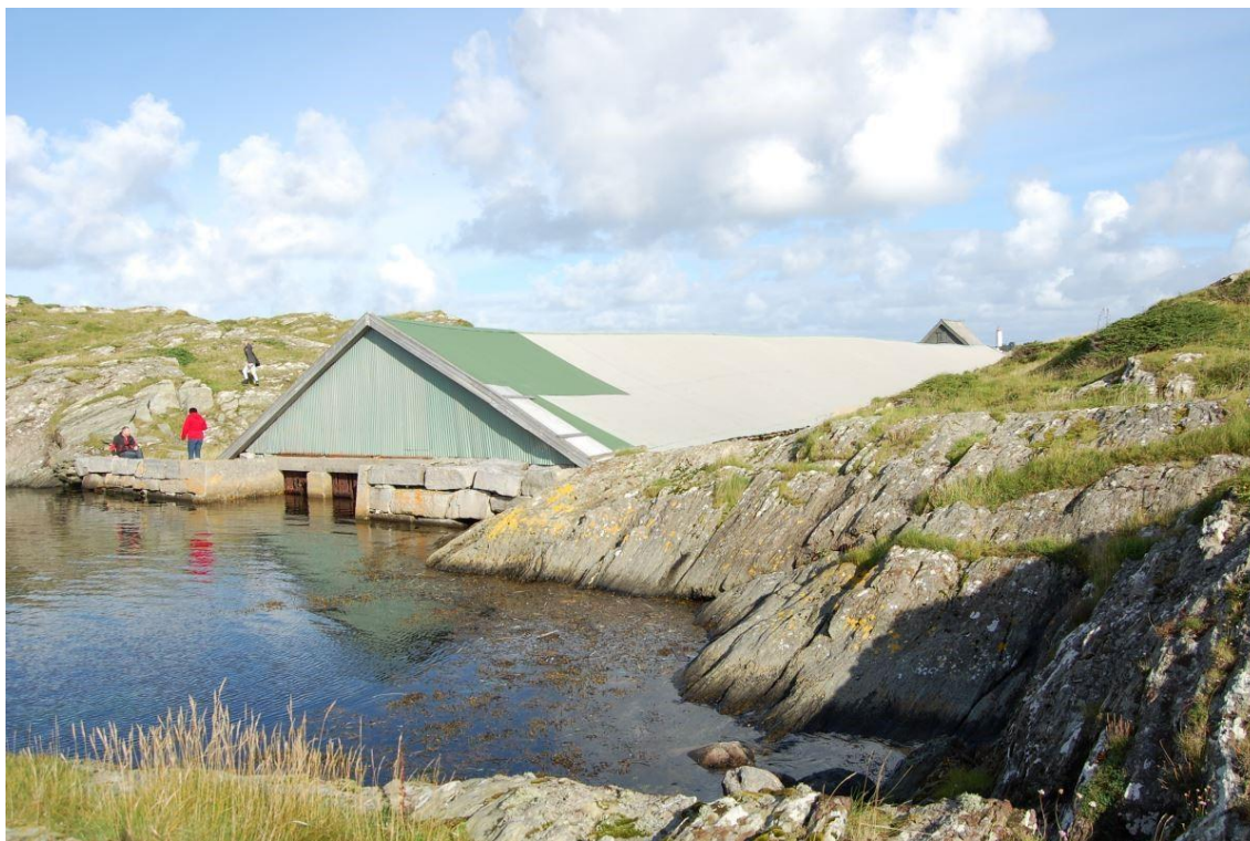
Hummerpark på Kvitsøy