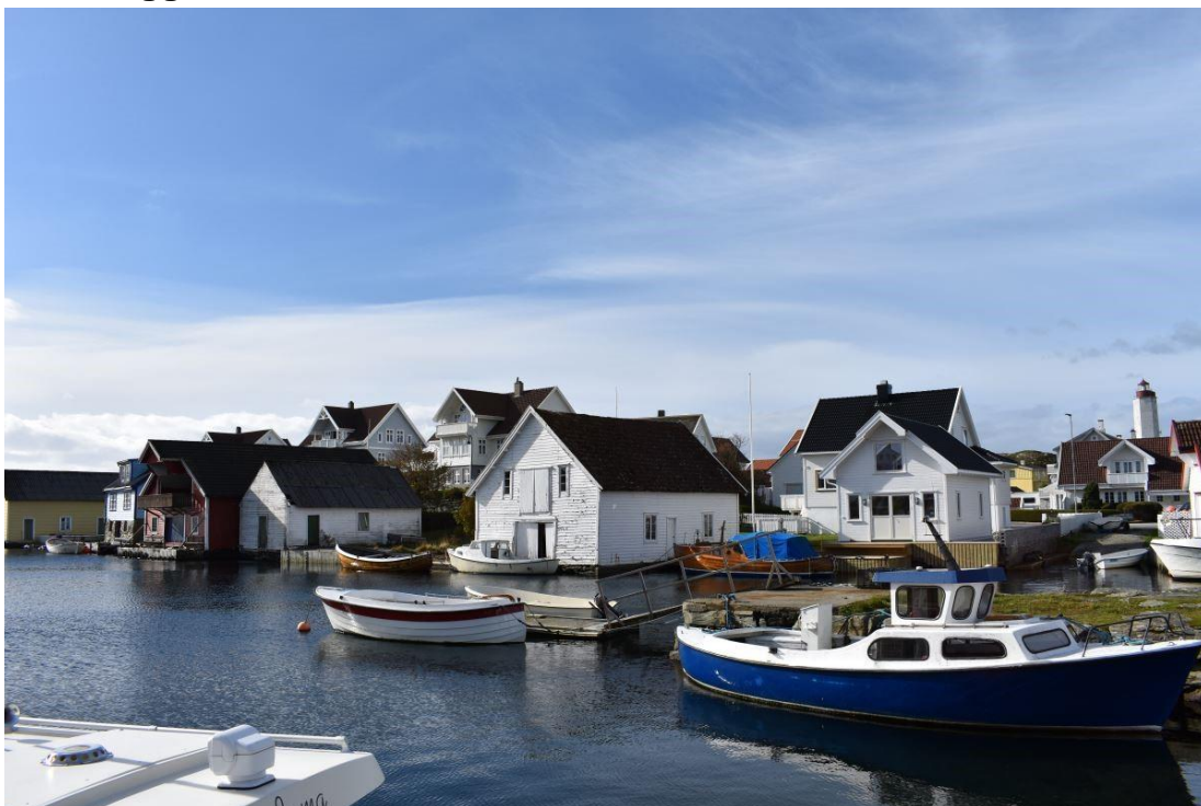
Sjøhus på Haganes.