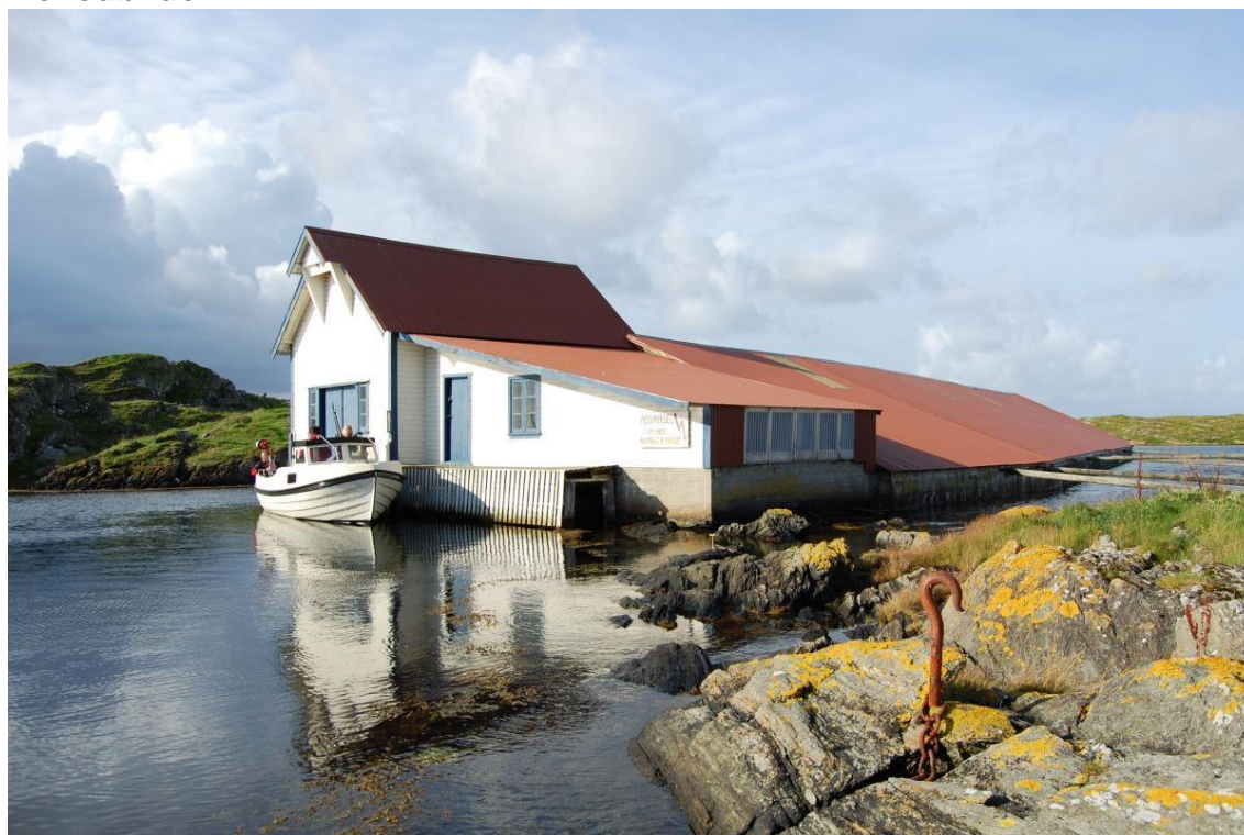
Rogaland fylkeskommune, 08.09.2011 22:13