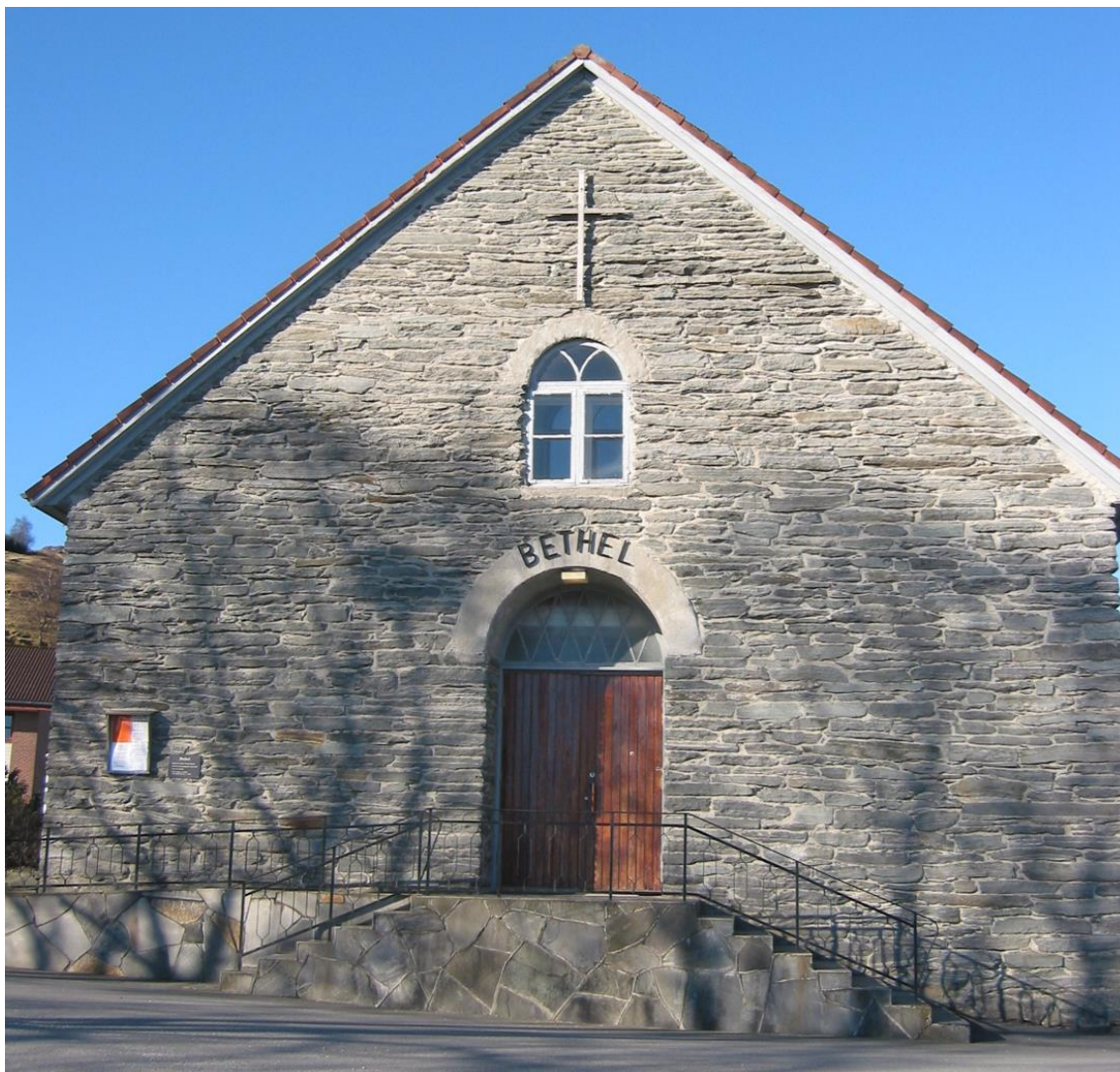
Bedehuset Bethel på Judaberg.