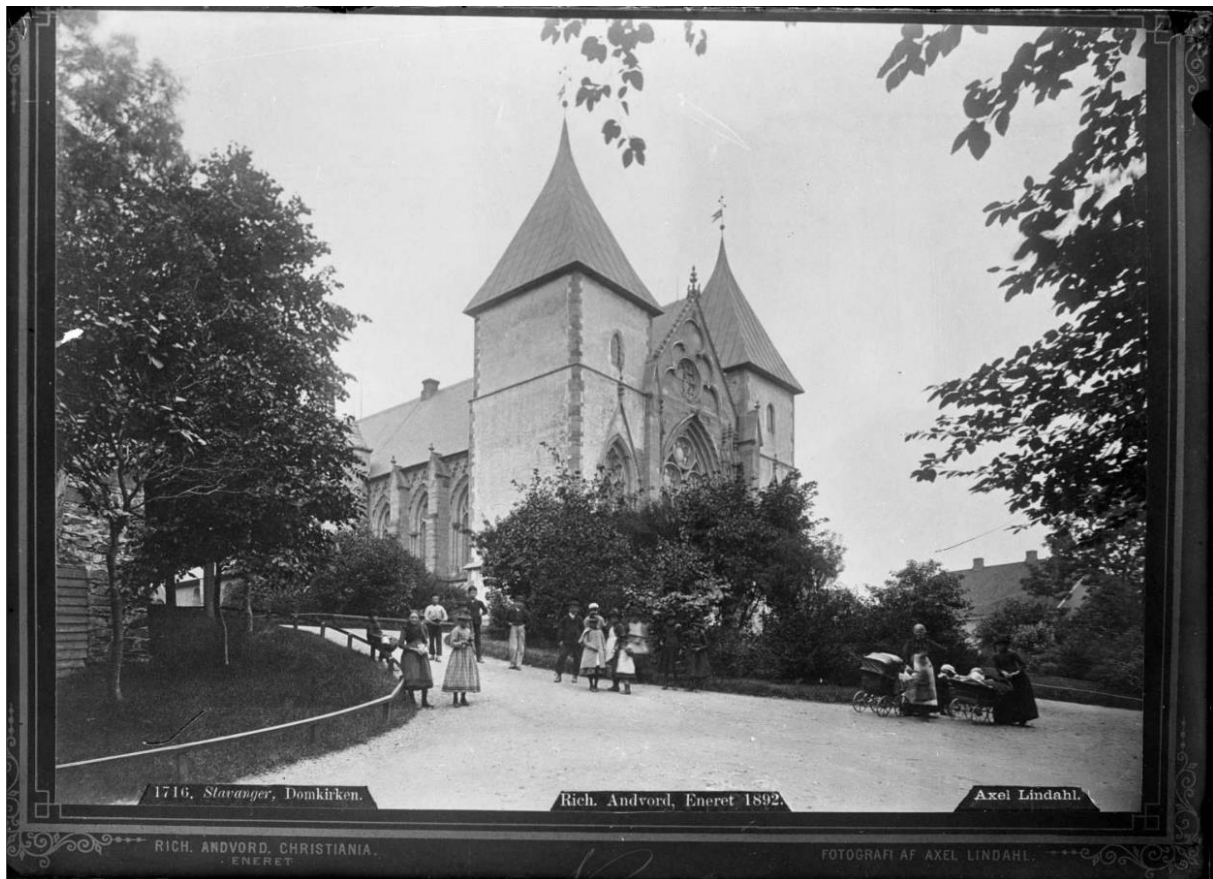
Stavanger domkyrkje er frå fyrste halvdel av 1100-talet.

Kong Håkon VI Magnussons død i 1380 blir rekna som slutten på det gamalnorske kongedømmet. Håkon var gift med Margrete, som var dotter til den danske kongen Valdemar Atterdag. Håkon og Margrete sin einaste son, Olav IV Håkonsson, blei valt til dansk konge i 1376, og arva Noreg etter faren i 1380. Olav var den fyrste kongen som regjerte over Danmark-Noreg, ein union som skulle vare i 434 år. Han døyde 17 år gamal i 1387 og mora Margrete overtok makta.