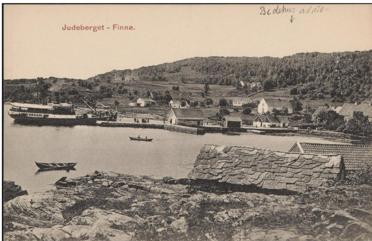
Postkort av Judaberg datert til 1911. Bethel synast til høgre i bilete.