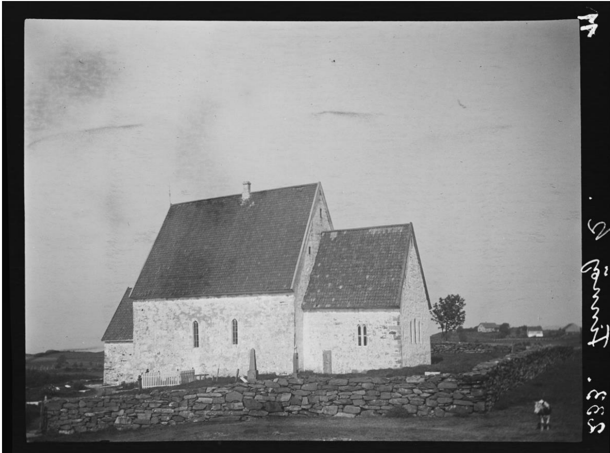
Hesby kyrkje på vestre Finnøy i 1920.

einaste lass stein då Bethel blei bygd. Byggekomiteen understreker det symbolske ved Bethel; «Huset bygges af Sten og skal derved vidne for kommende Slægter om Guds-Ordet og Guds-Rigets Bestandighed». Ein har nok òg late seg inspirere av dei gamle steinbygde mellomalderkyrkjene som det finst mange av i Ryfylke, til dømes Hesby kyrkje frå 1200-talet, på vestsida av Finnøy.