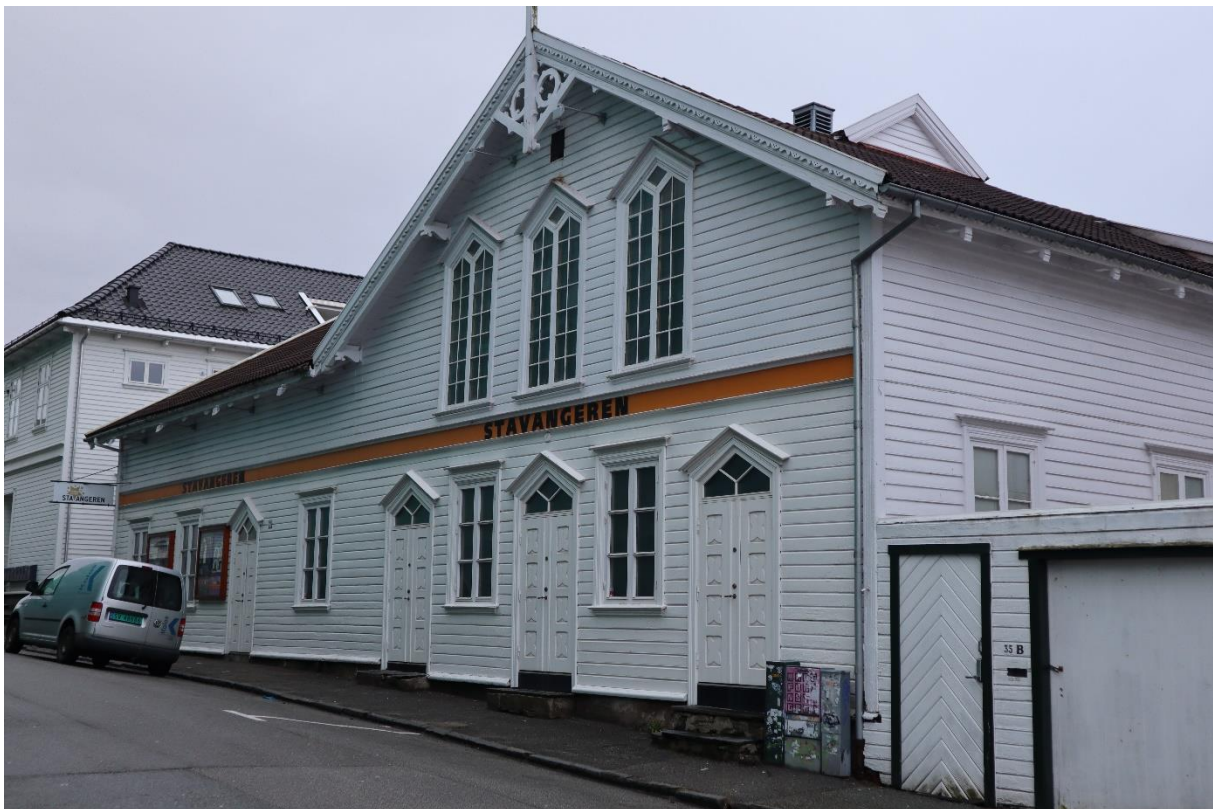
Bedehuset Bethania i 2023.

Frå 1878 ga Oftedal ut avisa Vestlandsposten, der han blei partiet Venstre sitt kristne alibi. Dette var i ei tid der austlandsprestane rekna Venstre for å vere «de vantroes» parti. Kombinasjonen av venstrepolitikk og lågkristendom kom til å prege Sørvestlandet, og dei såkalla «oftedølane» utgjorde etter kvart hovudtyngda av det moderate Venstre. Oftedal var aktiv i lokalpolitikken i Stavanger, og sat i både bystyret og formannskapet. I 1883-85 og 1889-91 var Oftedal valt inn på Stortinget. Her engasjerte han seg sterkt i sosiale spørsmål, men er nok mest kjent for kampen mot Alexander Kiellands diktargasje.