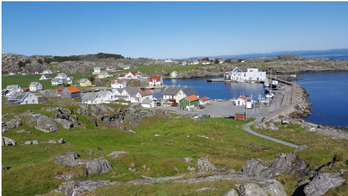
Sørrevågen på Utsira