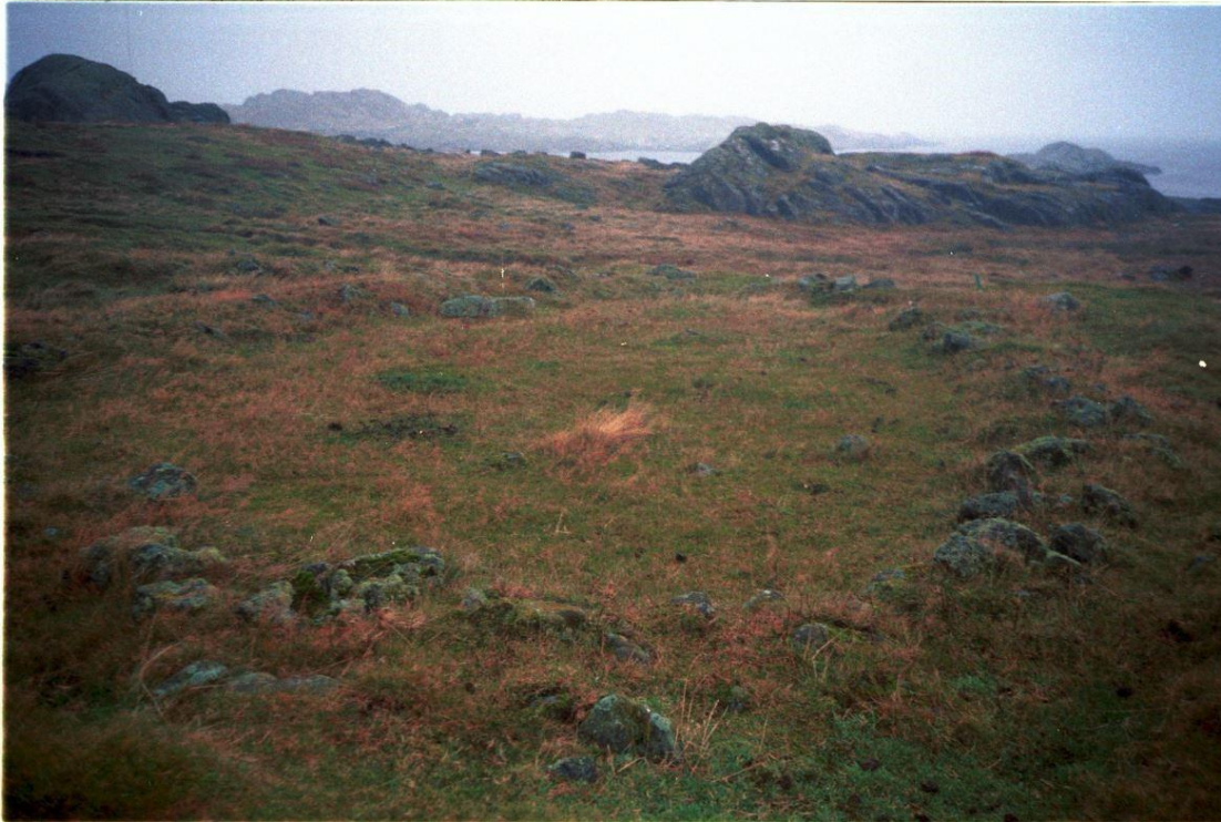
Forhistorisk tuft på Utsira