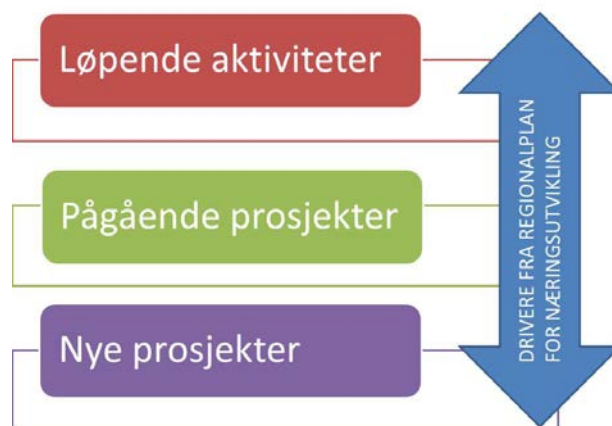
Figur 2: HP Nærings 2015 - struktur

Prosjekt og tiltak som skal finansieres, vil bli vurdert i lys av prioriteringene og føringene i handlingsprogrammet. De fem driverne innovasjon og innovasjonsstruktur, rekruttering og kompetanse, internasjonalisering, naturressurser og infrastruktur som er hentet fra Regionalplan for næringsutvikling, er gjennomgående. Disse vil bli tillagt vekt når nye søknader vurderes og prosjektmidler tildeles.